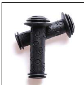
キッズ用グリップ