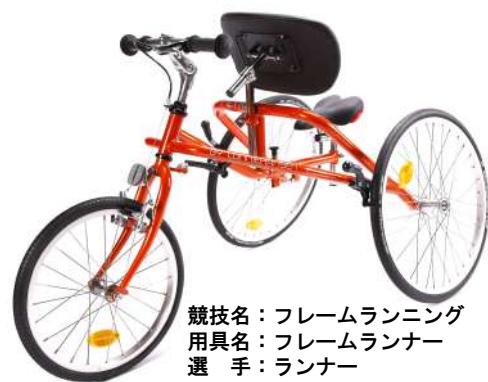
競技名：フレームランニング 用具名：フレームランナー 選手：ランナー