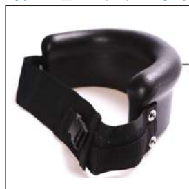
PUR チェストサポート (全3サイズ)