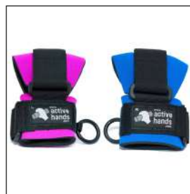
グリップエイド アクティブハンズ