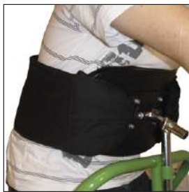
VELAチェストサポート+ペルト