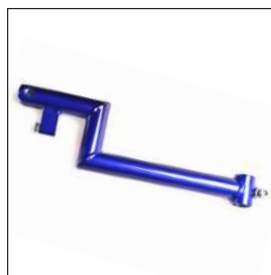
オフセットドロップリンク