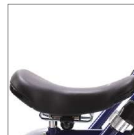
前後スライド式サドル