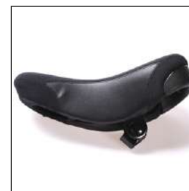
フリーライダーサドル