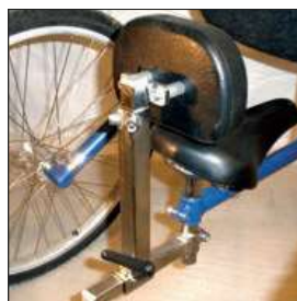
ムーンプレート ヒップサポート