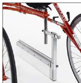
レッグセパレーター