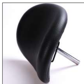
VELAチェストサポート